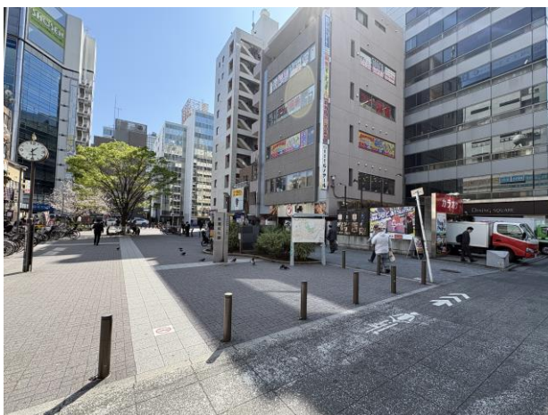
↑北側（秋葉原駅側）から公園を見た写真