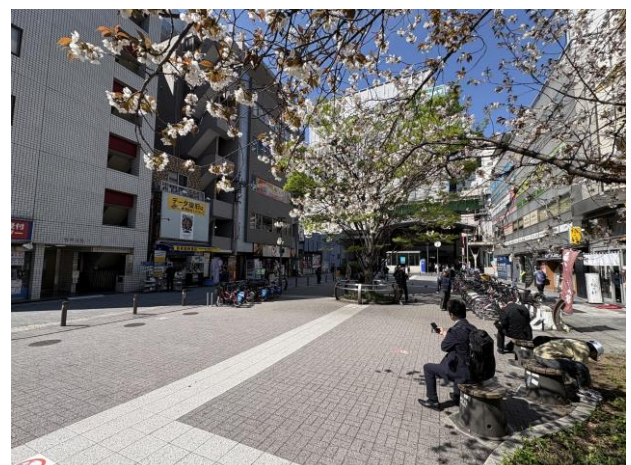
↑南側（和泉橋出張所側）から公園を見た写真